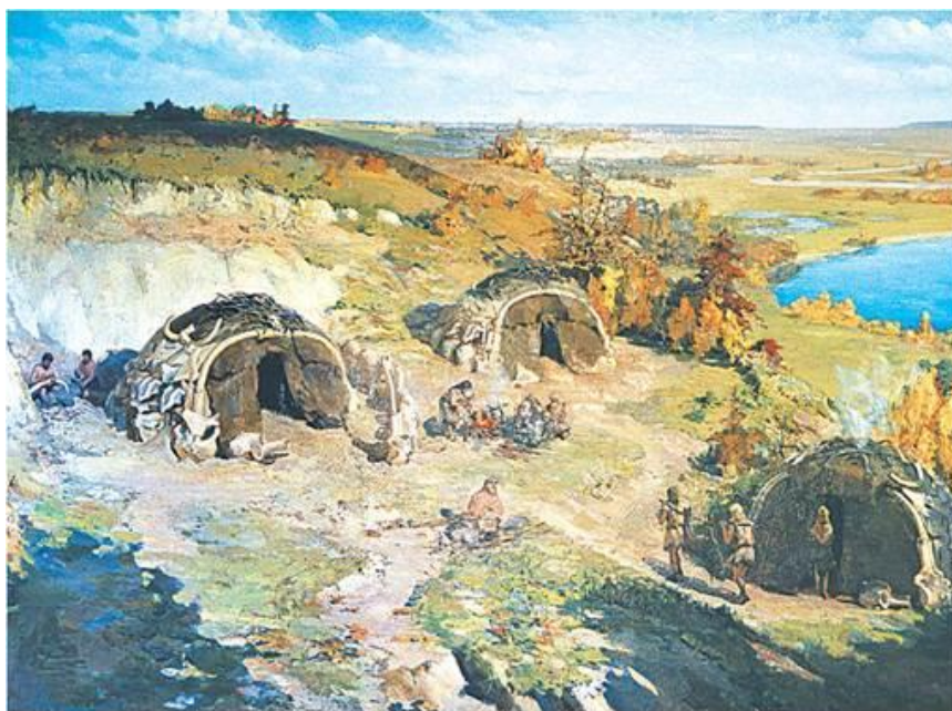
Мізинська стоянка. Картина І. Їжакевича

Завдання 1. Роздивіться ілюстрацію. Використовуючи текст підручника, поміркуйте, що ще можна було б намалювати на картині-реконструкції. Свої пропозиції сформулюйте за поданим початком: «На картині можна було б намалювати...»